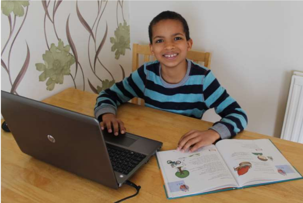
Een heerlijke werkplek...!

Zorg ook voor een goede werkruimte. Als kleine broer of zus rondom met lego aan het spelen is, wordt het wel erg lastig om je te concentreren.